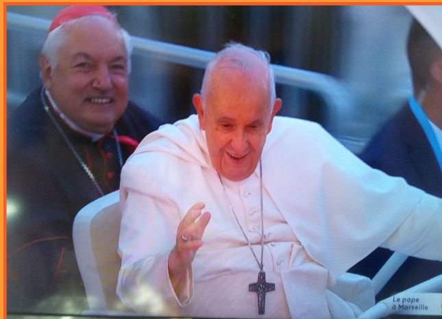
Le Pape FRANÇOIS à Marseille