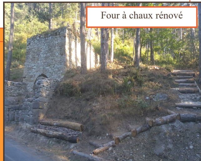
Four à chaux rénové