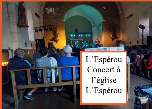
L'Espérou Concert à l'église L'Espérou