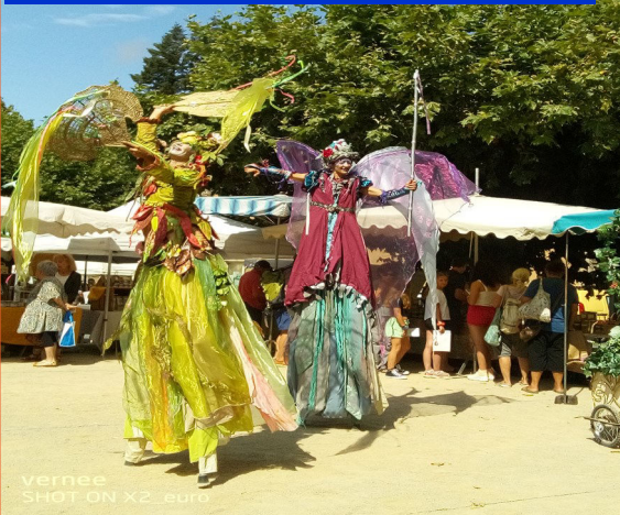
Spectacle : Marché 14 Août à Lanuéjols