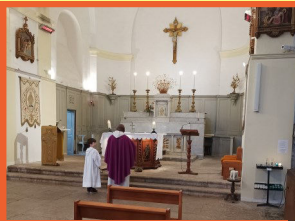
Messe des Cendres

Opération « Bol de Riz » Lanuéjols dimanche 17 mars