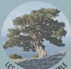
LES ARBRES DE LA BIBLE

« Aux chênes de Mambré, le Seigneur apparut à Abraham. » Genèse 18, 1