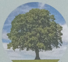
LES ARBRES DE LA BIBLE