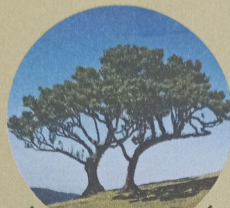
LES ARBRES DE LA BIBLE

« Vers le soir, la colombe revint, et voici qu'il y avait dans son bec un rameau d'olivier ! » Genèse 8, 11