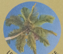
LES ARBRES DE LA BIBLE

« Nathanaël lui demande : "D'où me connais-tu ?" Jésus lui répond : "Avant que Philippe t'appelle, quand tu étais sous le figuier, je t'ai vu." » Jean 1, 48