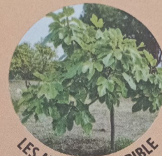
LES ARBRES DE LA BIBLE

« Le juste poussera comme un cèdre du Liban. » cf. Psaume 91, 13